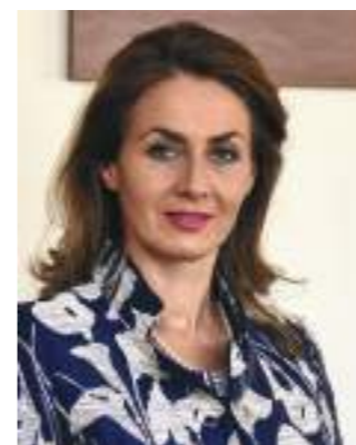
Brankica Janković, poverenica za zaštitu ravnopravnosti Republike Srbije