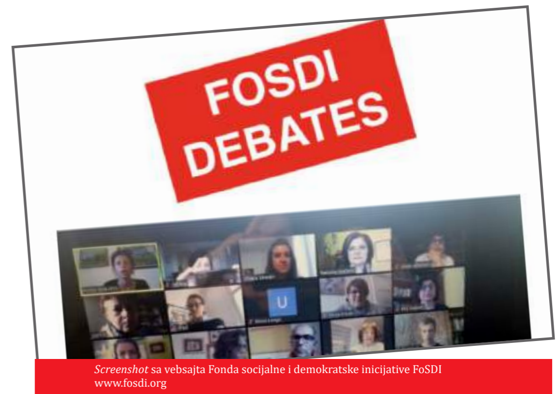
Screenshot sa vebsajta Fonda socijalne i demokratske inicijative FoSDI www.fosdi.org

čela pandemija i epidemija i vanredno stanje. U Kragujevcu jedva sastavljamo kraj s krajem, mediji jedva opstaju, nemaju godinama raspisan ni konkurs, Kragujevac je retka lokalna samouprava koja nije uopšte imala konkurs za sufinansiranje medijskih sadržaja. Kragujevačke novine sa tako dugom tradicijom izlaze sada dvonedeljno, portali se snalaze. Novinari su i pre toga bili egzistencijalno ugroženi, jer svi koji rade i bave se ovim poslom vole ovaj posao, ali od ovog posla se teško živi. Biće teže posle pandemije odnosno kada ovo prođe jer posledice epidemije svakako će biti snažne, biće otpuštanja zaposlenih i ljudi će sve teže da žive... Mnogo zavisi od brzine našeg oporavka i od jačine tih posledica sa kojima ćemo morati da se suočimo.”