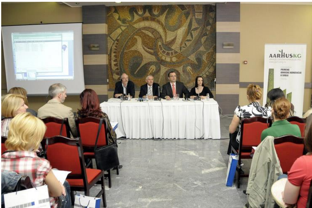
Slika 6. Civilno društvo i lokalna vlast, Arhus, Kragujevac

Proces urođnjavanja, odnosno ravnopravno rodno učešće u procesima donošenja odluka i kreiranju javnih politika skromno je predviđen u tekstovima nekoliko strategija i akcionih planova u Srbiji. Budući da je krovni akt za pitanje rodne ravnopravnosti Zakon o ravnopravnosti polova , možemo reći da tek predstoji rad na donošenju podzakonskih akata koja će definisati nadležnosti, principe nadzora nad primenom Zakona, obaveznost i sankcije u slučaju neispunjavanja odredbi Zakona.