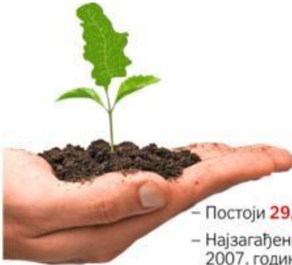
Slika 1. Stanje žvоте sredine u Srbiji, prikaz B.Knežević

U Srbiji postoje insitucionalni i legislativni okvir i razvijen nevladin sektor koji se bave pitanjima zaštite životne sredine i održivog razvoja. Legislativni okvir se razvijao tokom proteklih 10 godina oslanjajući se na dokumenta usvojena u međunarodnim organizacijama i inicijativama, od kojih su mnoga ratifikovana, te su i obavezujuća za vladu Republike Srbije. U procesu pristupanja Evropskoj uniji koji je složen i zahtevan kada je reč o izmeni zakonskog okvira ali i kada je reč o korišćenju i upravljanju resursima, vlast se na svim nivoima susreće sa ozbiljnim izazovima i preprekama.